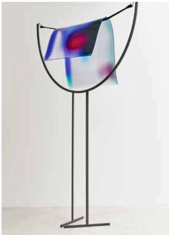
Neutral (Openhearted) , uit het project #Evidence , 2015-2017 Sculptuur uit metaal, Inkjet-print op vinyl, rubber