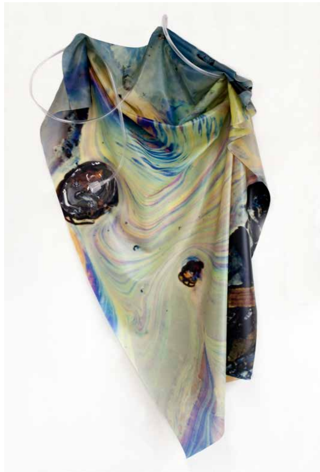
Petrified Sensibilities 04, 2017 Sculptuur uit Inkjet-print op latex, zuurstofmasker, zuurstofslang