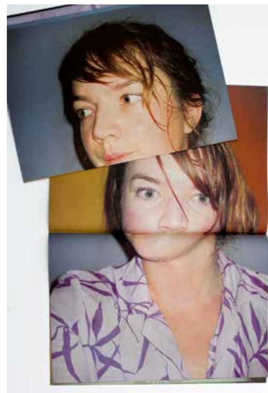
The Daily Exhaustion gepubliceerd door KODOJI, 2010

Sculptuur uit polystyreen, protheses, glasvezel, metaal, koper buis, LED-schoenen, Inkjet-prints op rubberen anti-slipmatten.